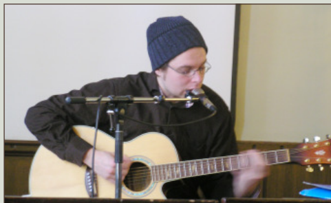
Karhumauri esiintyi 5.3. yhdistyksen vuosikokouksessa Tampereella.

Omaa evästä ja säänmukainen varustus mukaan. Ennakkoilmoittautumiset ja tiedustelut Ikimetsän ystävät ry:n sihteerille.