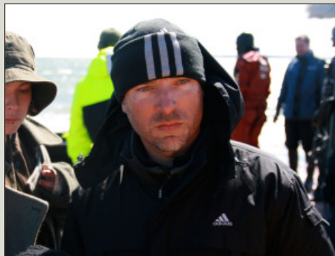
Elokuvaohjaaja ja Ikimetsän ystävät ry:n jäsen Aku Louhimies (s. 1968) Käsky-elokuvan kuvauksissa saaristossa.

Mielestäni lasten suhteesta luontoon tulisi olla huolissaan. Näyttää siltä, että Suomessa vieraannutaan luonnosta ja ryhdytään pelkäämään sitä. Kun lapset saavat viettää aikaa metsässä, uskon että heille kasvaa vahva ja kunnioittava