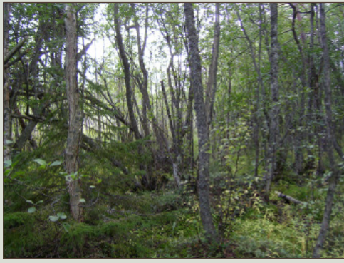
Itäjärven suojelualueen tervaleppämetsikköä suolampien rantamilla. AJ