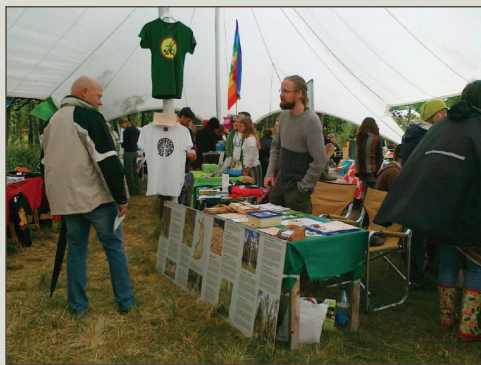
Ikimetsän ystävien kojulla Faces-kävijöille valistettiin Luonnonperintösäätiön olemassa olosta. Toimintaa saattoi tukea myös ostamalla uuden Haapa-logolla varustetun t-paidan.