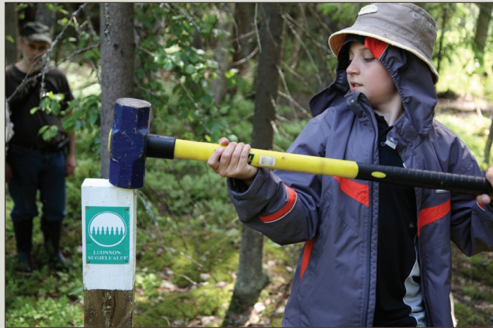
Investointi metsien suojeluun on pysyvä sijoitus, jonka arvo säilyy sukupolvelta toiselle. Yli-Myllyn suojelualueen tolpat ovat nyt tiukasti paikoillaan.

Sitten on joukko kansalaisia joille mahdollisuus omakohtaisesti nähdä koskematon luonto on houkuttelevampi ajatus kuin kaupungin rientoihin heittäytyminen. Vietin loppukesän Ruotsin Lapissa lasteni kanssa vaeltaen. Rinkka selässä kävelen hankittu tieto siitä, että ympärillä on