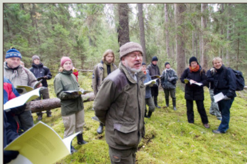
Metsiensuojelukurssilla opeteltiin tunnistamaan ja etsi- mään suojelunarvoisia metsiä.